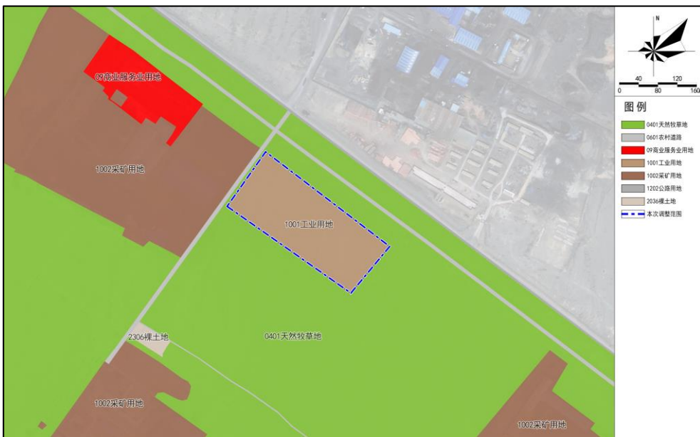
调整前用地规划图

将现行连队“通则式”规划的地块（02-001）的规划工业用地（1001）调整为090105（公用设施营业网点用地），用地面积4.18公顷保持不变。