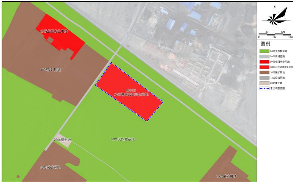
调整后用地规划图