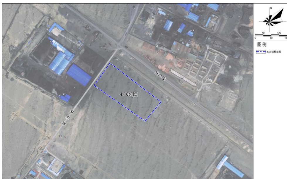
现状影像图（区域位置图）

本次调整地块位于红山农场 7 连，紧邻区域道路 Z501 线，距博尔羌吉镇-二红山社区约 1.7 公里。该地块现状为天然牧草地，规划为工业用地（用地分类代码 1001），面积 41787.39 平方米。